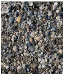
van schelpen of...