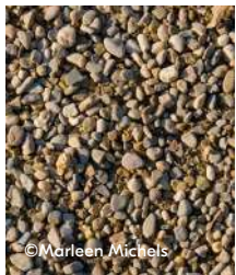
Halfverhardingen van grind of...