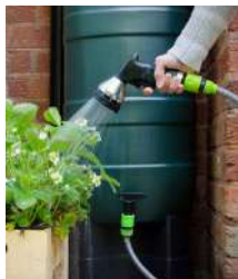
Regenton en tuinslang