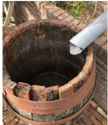
Regenwateropvang in regenton of...