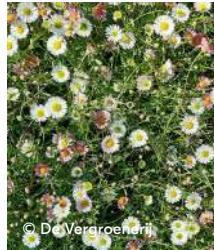
planten voor langs het pad: muurfijnstraal