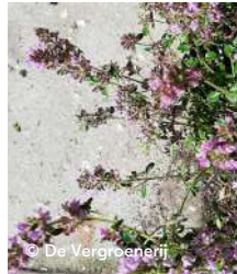
planten voor langs/ in het pad: kruiptijm of...