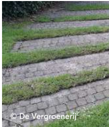
pad van stroken keien/ klinkers of...