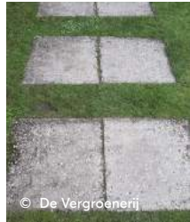
Betonnen tegel in gras of....