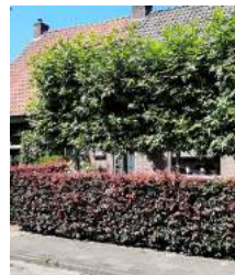
Leiplataan met rode beukenhaag