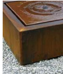
Watertafel van cortenstaal