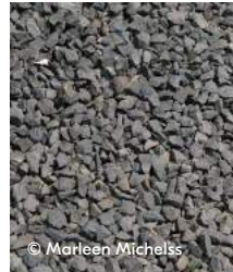
Grind, olivijn of schelpen als halfverharding